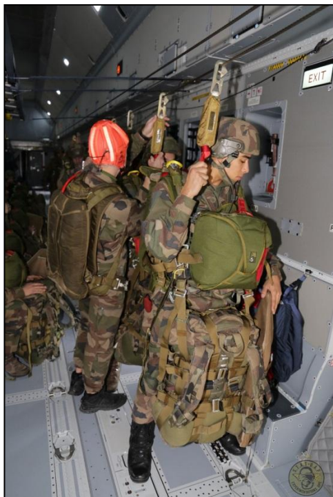
Maquettage des parachutistes en SOA équipés FELIN en soute d'A400M