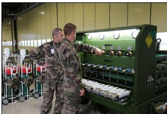
Le DO 2 2A