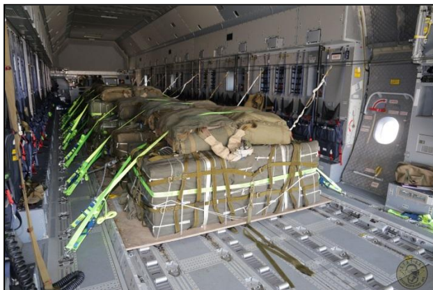
PD11 en soute d'un A400M.