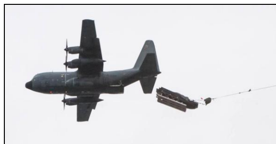
Mise à la mer de l'ECUME.