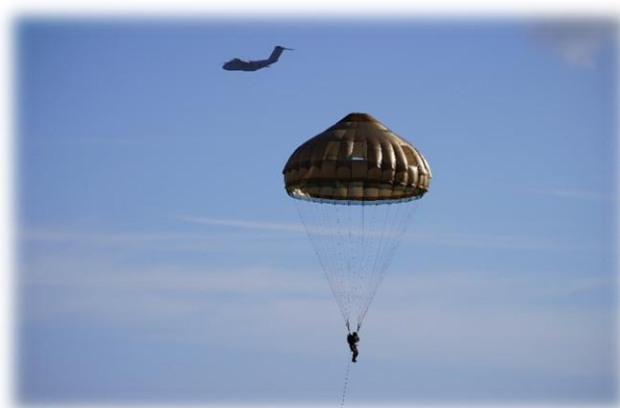
Parachutiste du 2 e REP en EPC/EL110 après son parachutage de l'A400M.

La suite consistera à expérimenter le parachutage de 80 parachutistes équipés EPC/EL110 par les deux portes simultanément et à assister aux essais de largage par éjection... Le travail avance mais de nombreuses choses restent à travailler comme le largage dit « 3 issues » et l'anticipation sur la mise en place des nouveaux systèmes de livraison par air (dispositifs nouveaux permettant de conditionner des fardeaux).