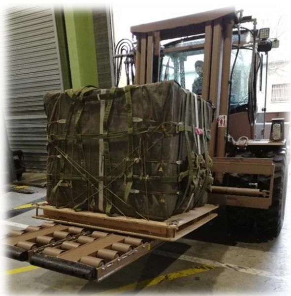
Le CELA s'apprêtant à charger une charge PP1 dans le MFE 4 C160 du 1 er RTP.

Les campagnes et missions d'expérimentations et d'évaluations du groupement ont connu, à partir du 16 mars 2020, un sérieux ralentissement : l'ensemble des vols et des sauts et largages associés a été annulé et tandis que nos principaux correspondants, qu'ils soient étatiques (DGA 1 ) ou industriels, se confinaient ou étaient employés sur des missions liées au « COVID-19 » (CEAM 2 ou GAMSTAT 3 ), le groupement en a profité pour mettre à jour et travailler un certain nombre de dossiers comme le rapport d'évaluation technico-opérationnelle relative au CELA, le nouveau chariot élévateur léger aérotransportable.