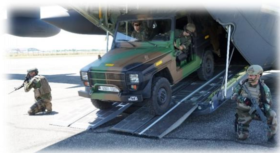
Maquettage poser d'assaut à partir de KC130J.

de la série des « J » avec capacité de ravitaillement en vol) et d'amorcer les études sur le poser d'assaut.